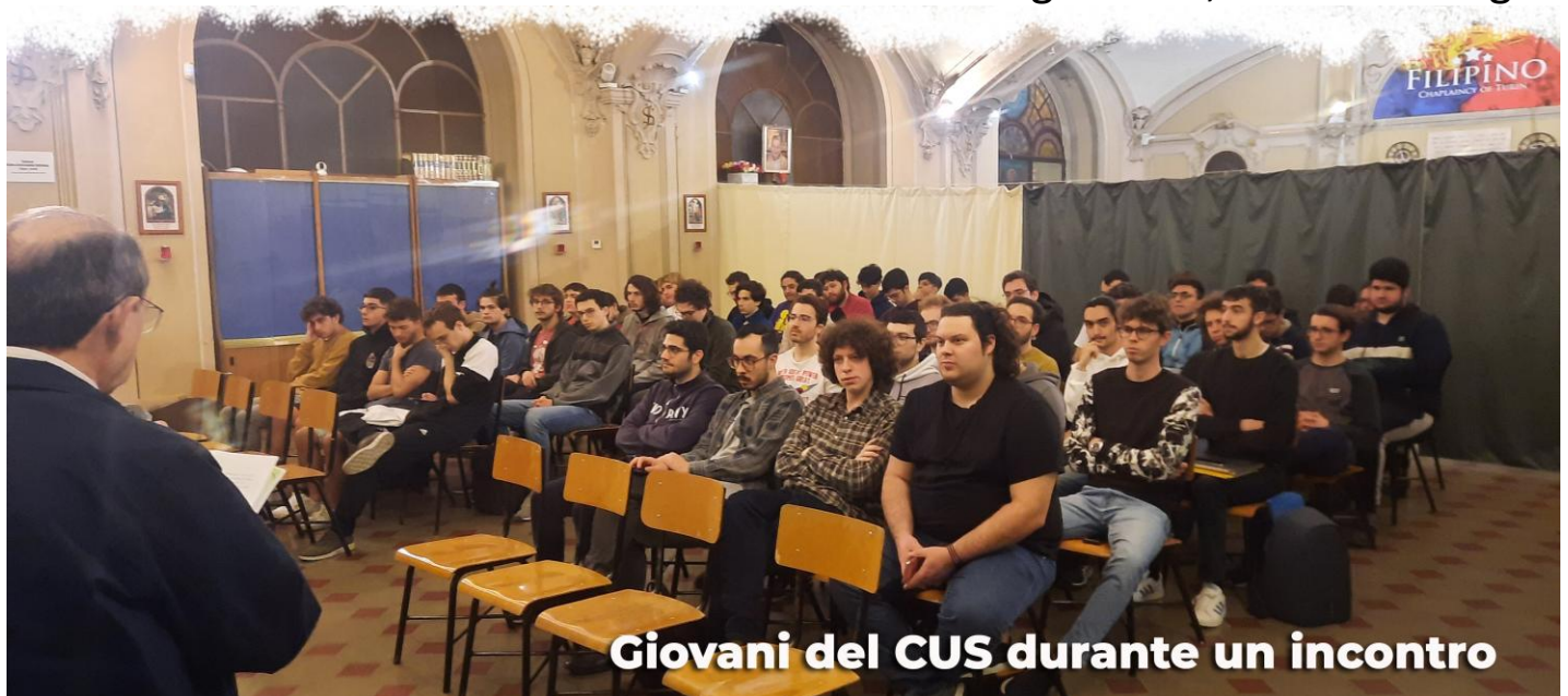
Giovani del CUS durante un incontro

La loro vita è certamente scandita dalle lezioni e dagli esami, ma anche dagli