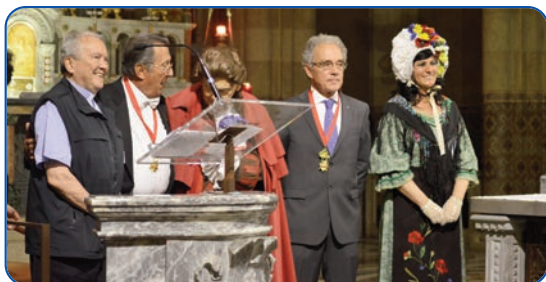
Alla sera Gianduaia e Giacometta ospiti al San Giovannino...!