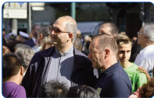
... ed al pomeriggio il primo ed il secondo oratorio di Don Bosco in Piazza Solferino salutano il Santo Padre