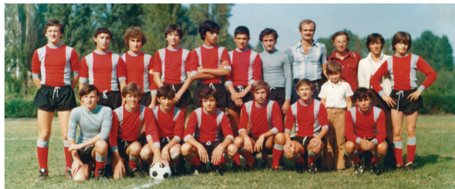
La squadra «Fulminea» con Sandro Mazzola a Milano, settembre 1978

La Fulminea nasce settant'anni fa nella Borgata Paradiso, al confine con Collegno, presso la parrocchia Nostra Signora del Sacro Cuore di Gesù in via Germonio. Non appena spenti i fuochi della guerra, laggiù viene fondato l'oratorio. E qui che nel novembre 1948 si costituisce una squadra di calcio, alimentata dalle ondate di nuova popolazione. La «Spes», nome poco battagliero, è presto abbandonato per quello di «Fulminea». La squadra giallo-blu si sviluppa inarrestabile in ogni categoria. Nei primi anni Sessanta i suoi successi la portano oltre borgata, tant'è che per due anni, dal 1963 al 1965, gli juniores sono campioni provinciali. Nel 1968 la fusione con la Dynamo porta ad un'ulteriore evoluzione. La nuova squadra va in trasferta in Italia e in Europa, specie